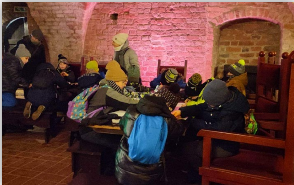
Wybrane zdjęcia z wydarzenia